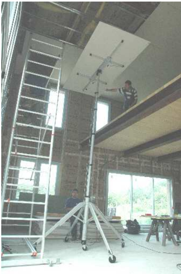
DW 520 avec rallonge pour levage 6 mètres