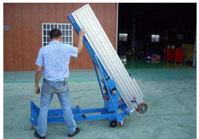
Das Fahrgestell kann geklappt werden