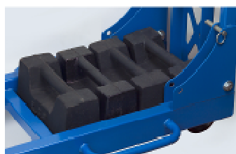
Kontergewicht 4 x 22,5 kg