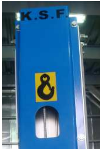
Kabelschutz mit Kranöse