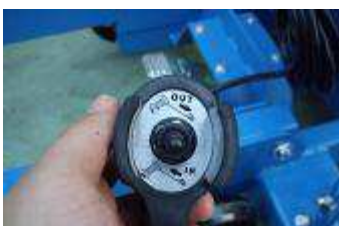
Hängetaster steckbar mit Elektrokabel 5 m Länge