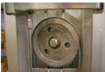
Laufrollen und Kabelschutz aus Stahl