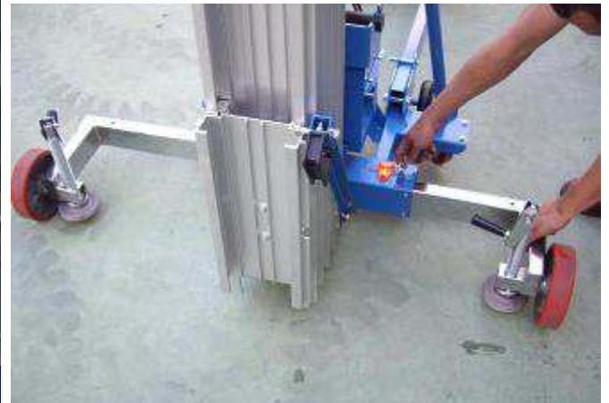
Einstellbare Seitliche Ausleger mit Libellenwaage und Stützfüße mit Spindel für unebenen Boden