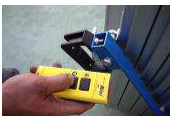
Funkfersteuerung mit Not-Aus