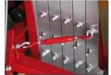
Tendeur de blocage pour le transport