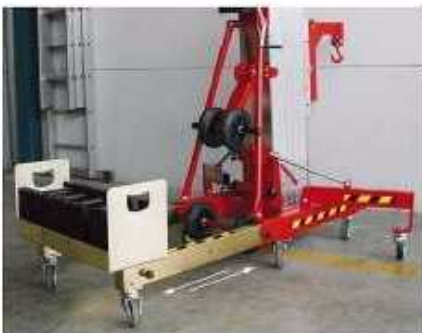
Pour travail en façade contre poids avec bac (option)