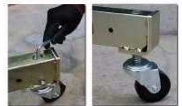
2 roues à hauteur réglable