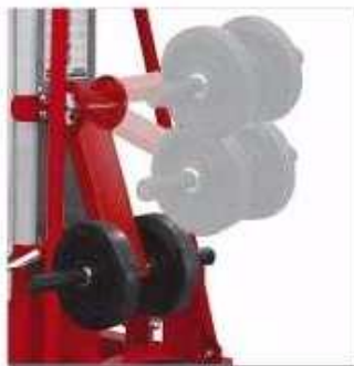
Support roue de transport ajustable en 3 points