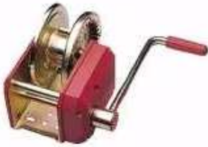
Treuil 1 ou 2 manivelles avec frein automatique