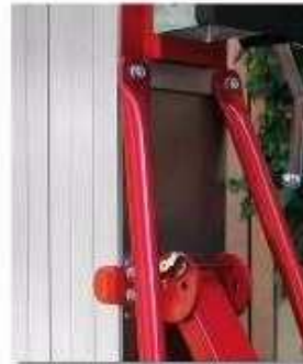
2 stabilisateurs latéraux