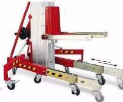
Pieds coulissants dans le châssis devant les mâts ou derrière les mâts