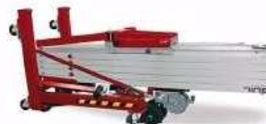
Position pour transport horizontal