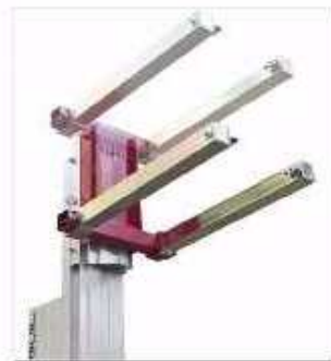
Fourches inversables et à largeur réglable