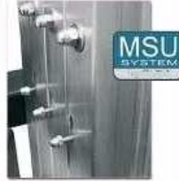
Déblocage des mâts